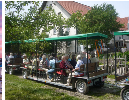
Ausflug nach Bad Waldsee-Mostbauer