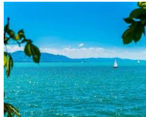
4 - tägige Radreise Bodensee